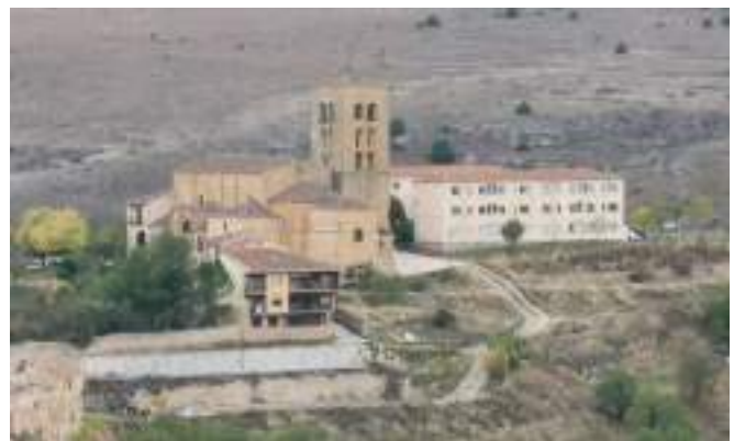
Iglesia de la Virgen de la Peña